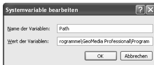
Abbildung: Setzen der PATH-Variablen

Die dort vorhandenen Werte werden beibehalten und um den Pfad ergänzt, der auf das Programmverzeichnis von GeoMedia verweist, beispielsweise: